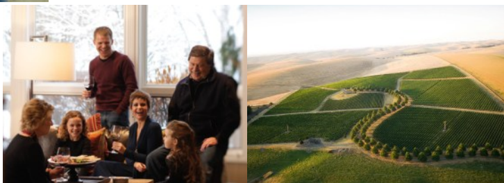
フィギンズ・ファミリー