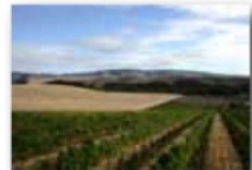
Mill Creek Upland