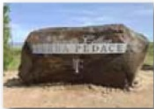
Serra Pedace Vineyard