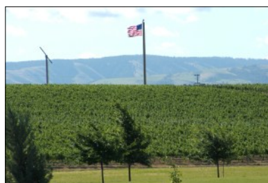
レス・エステート・ヴィンヤード