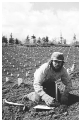
1971年 ニューバーグのクォーター・マイル・レーンに最初の土地を購入

アデルスハイムは、「未知のワイン産地で世界に通用するワインを造る」という大きな夢と楽観的な精神から、1971年にウイラメット・ヴァレー北部のシュハイラム・マウンテンズに設立されました。創設者デイヴィッド・アデルスハイムは、当時まだほとんど知られていなかったこの地の冷涼な気候、多様な土壌と標高、そして土地の持つ可能性に惹かれ、ピノ・ノワールとシャルドネに特化した高品質なワイン造りを始めました。AVA制度の確立、クローン選定、シャルドネ再評価の牽引、業界教育イベントの創設など、オレゴンワインの品質向上と国際的評価の確立において極めて重要な役割を果たし、現在もこの地域、そしてオレゴンワイン産業の発展のため精力的に活動しています。デイヴィッドはワイン造りからは引退しましたが、その哲学は次世代に継承され、「次の50年」に向けて、ワインの品質、サステナビリティ