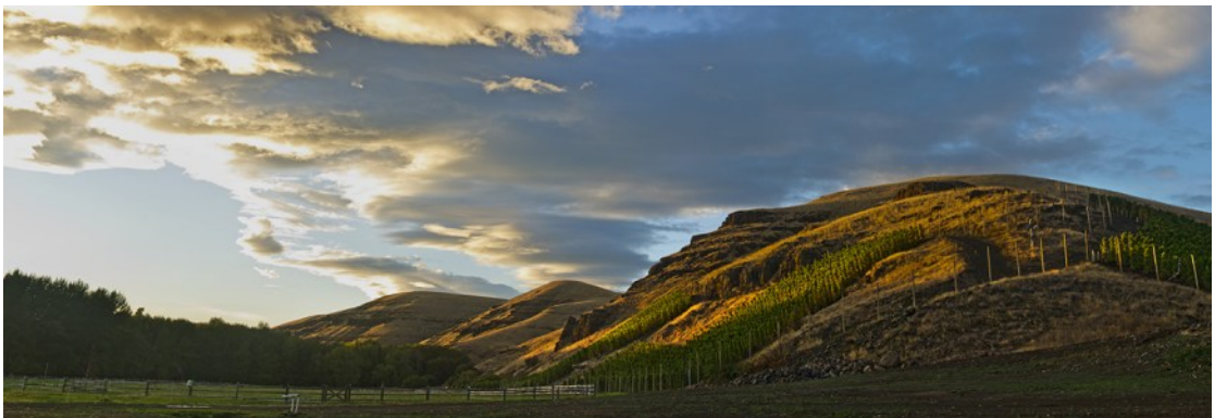
オー・カテゴリー・ヴィンヤード (ワラワラ・ヴァレー)