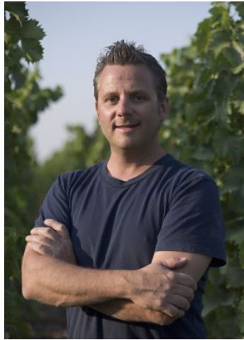
クリストフ・パロン