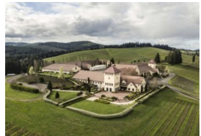
丘の上に建つシャトー様式のワイナリー 米国最大面積を誇るBiodynamic® 認証の自社畑

果樹園や花畑、菜園、ベリー畑が散在し、養蜂場や豚肉加工場もあります。この荘園のような環境は中世の自給自足の共同体を想起させるようですが、ワインづくりでは最先端の地でもあります。最新式の醸造機器と技術を最新の環境保全型のオーガニック農法と共に用いており、エステートレストランに於けるワールドクラスの料理プログラムは全てを見事に一体化させています。ピュアで洗練されたキング・エステートのワインは上質な料理と自然な相性をみせています。ワインのプロの皆様にはキング・エステートのピノ・グリが過去4年間連続して全米のレストランでNo.1の米国産ピノ・グリになったことにご賛同していただけるものと思います。