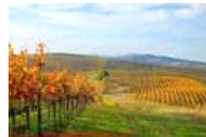
ナバ・ヴァレーのブドウ畑