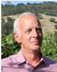
ジョナサン・ペイ