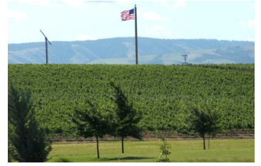
レス・ヴィンヤード