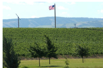
レス・ヴィンヤード