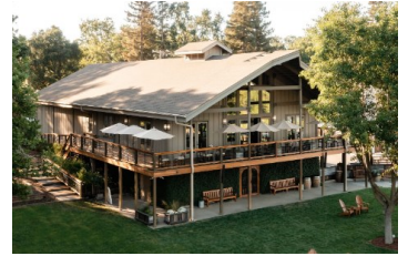
テイスティング・ルーム

FAMILY OWNED & OPERATED SINCE 1968 —1968年から続く家族経営—